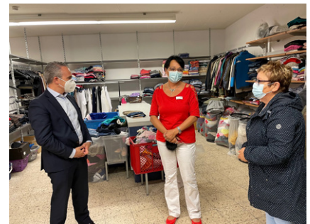
Die VIP-Gäste beim Tag des offenen Kleiderladens.