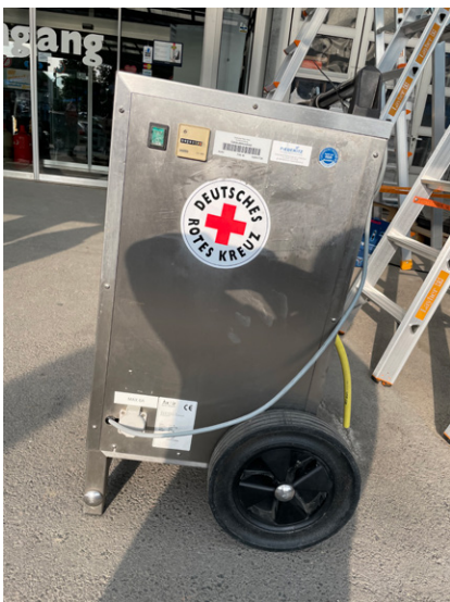
Ein Bautrockner aus der DRK-Bundesvorhaltung.

Eifelkreis (rh) Ende Juli wurden die ersten Bautrockner aus dem DRK-Logistikzentrum Berlin-Schönefeld an die Betroffenen der Unwetterkatastrophe im Eifelkreis ausgehändigt.