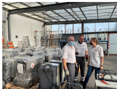
Die Truppe des DRK-Ortsvereins Bitburg beim ersten Ausgabetermin.

An dieser Stelle möchten wir uns, neben den vielen Spendern, ausdrücklich bei der Firma Rolf Riewer (Bitburg) für seine vielfältige Unterstützung bedanken. Gedankt sei auch den Angehörigen der Bereitschaften, die diese Ausleihaktion begleiten und durchführen.