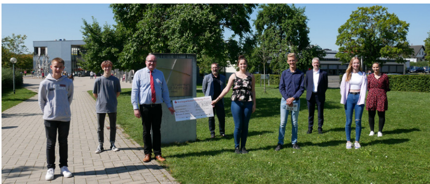
Die „Mätthi hilft“ - Großartige Spendenaktion der St. Matthias-Schule Bitburg für die Flutopfer: Insgesamt kam ein Betrag in Höhe von 13.302,00 € zusammen.