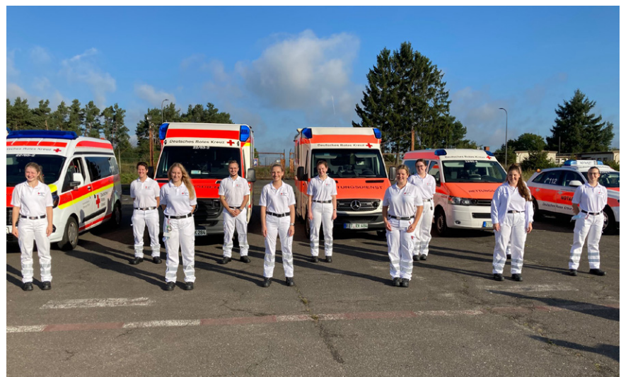
Die Teilnehmer des zweiten Fahrsicherheitstrainings auf dem Flugplatz Bitburg vom 11.09.2021.

Aktuelle Infos immer unter www.drk-bitburg-pruem.de