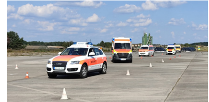
Die eingesetzte DRK-Fahrzeugflotte.

Den Teilnehmer*innen hatte es ebenfalls riesigen Spaß gemacht.