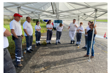
Einweisung der Fahrsicherheitstruppe vom 05.09.21

Dieses Fahrsicherheitstraining wurde im Rahmen des Betrieblichen Gesundheitsmanagements (BGM) durchgeführt.