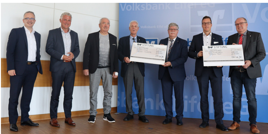
Fluthilfe: Mitarbeiterinnen und Mitarbeiter sowie die Stiftung der R+V-Versicherung spenden für die Flutopfer des Eifelkreises.