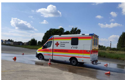
Rettungstransportwagen im Sicherheitstraining.

Eifelkreis (mb) Durch das zunehmende Verkehrsaufkommen, immer mehr rücksichtslose Verkehrsteilnehmer und steigende Einsatzzahlen sind Rettungskräfte vermehrt größeren Unfallgefahren ausgesetzt. Um in kritischen Situationen richtig reagieren zu können, führte der Rettungsdienst des DRK-Kreisverbandes Bitburg-Prüm an vier Samstagen im September ein professionelles Fahrsicherheitstraining auf dem Flugplatzgelände in Bitburg durch.