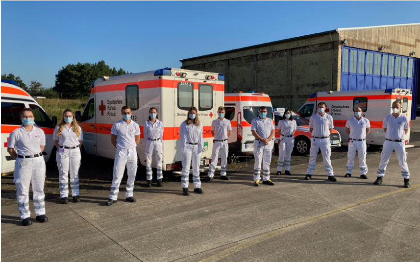
Die Teilnehmer des ersten Fahrsicherheitstrainings auf dem Flugplatz Bitburg vom 04.09.2021.

Eifelkreis (mb) Durch das zunehmende Verkehrsaufkommen, immer mehr rücksichtslose Verkehrsteilnehmer und steigende Einsatzzahlen sind Rettungskräfte vermehrt größeren Unfallgefahren ausgesetzt. Um in kritischen Situationen richtig reagieren zu können, führte der Rettungsdienst des DRK-Kreisverbandes Bitburg-Prüm an vier Samstagen im September ein professionelles Fahrsicherheitstraining auf dem Flugplatzgelände in Bitburg durch.