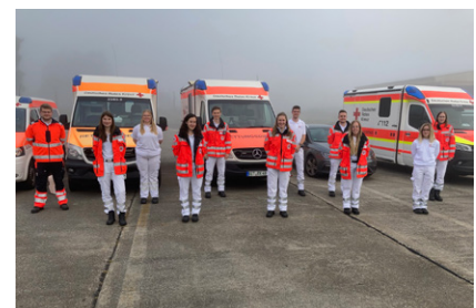
Die Teilnehmergruppe vom 25.09.2021.