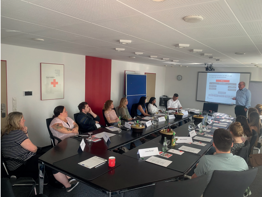
Ein Blick in den Konferenzraum beim „Welcome-Day“

Eifelkreis (rh) Am Mittwoch, den 21. Juni 2023 fand der erste „Welcome-Day“ im DRK-Kreisverband Bitburg-Prüm e.V. mit 13 neuen Mitarbeiter*innen im Konferenzraum der Kreisgeschäftsstelle in Bitburg statt.